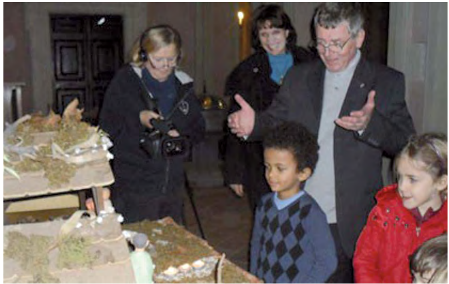
KERSTSAMENZANG 2010. De kinderen mogen het Kindeke in de kribbe leggen.

Terwijl we zelf ons nooit veel aantrokken van het dichtstbijzijnde continent Afrika, zijn we geschokt dat de Chinezen het nu hebben "ontdekt" en daar de toevoer van mineralen naar hun snel groeiende economie via harde con-